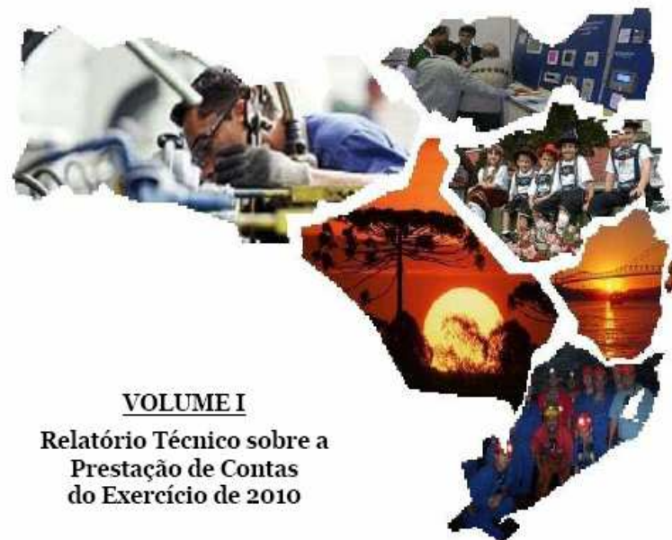
VOLUME I Relatório Técnico sobre a Prestação de Contas do Exercício de 2010

Repasse aos Municípios, Restos a Pagar, etc)